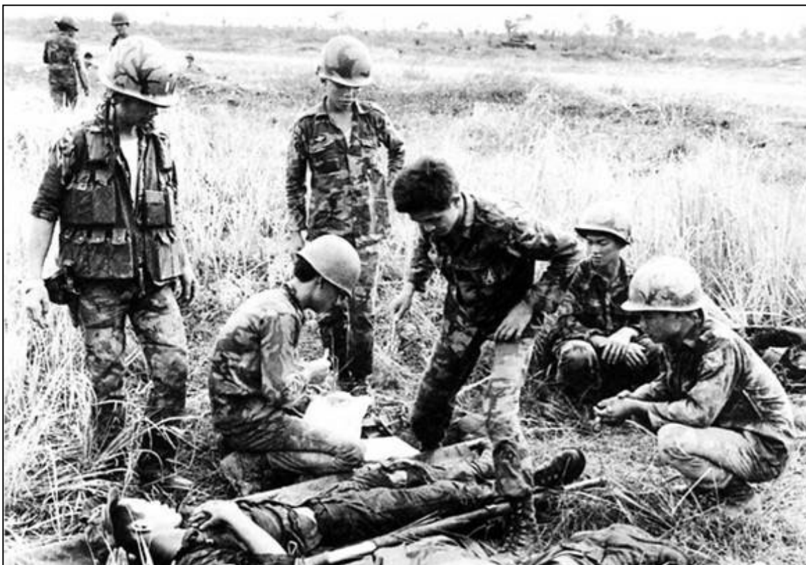
Cứu thương giữa chiến trường