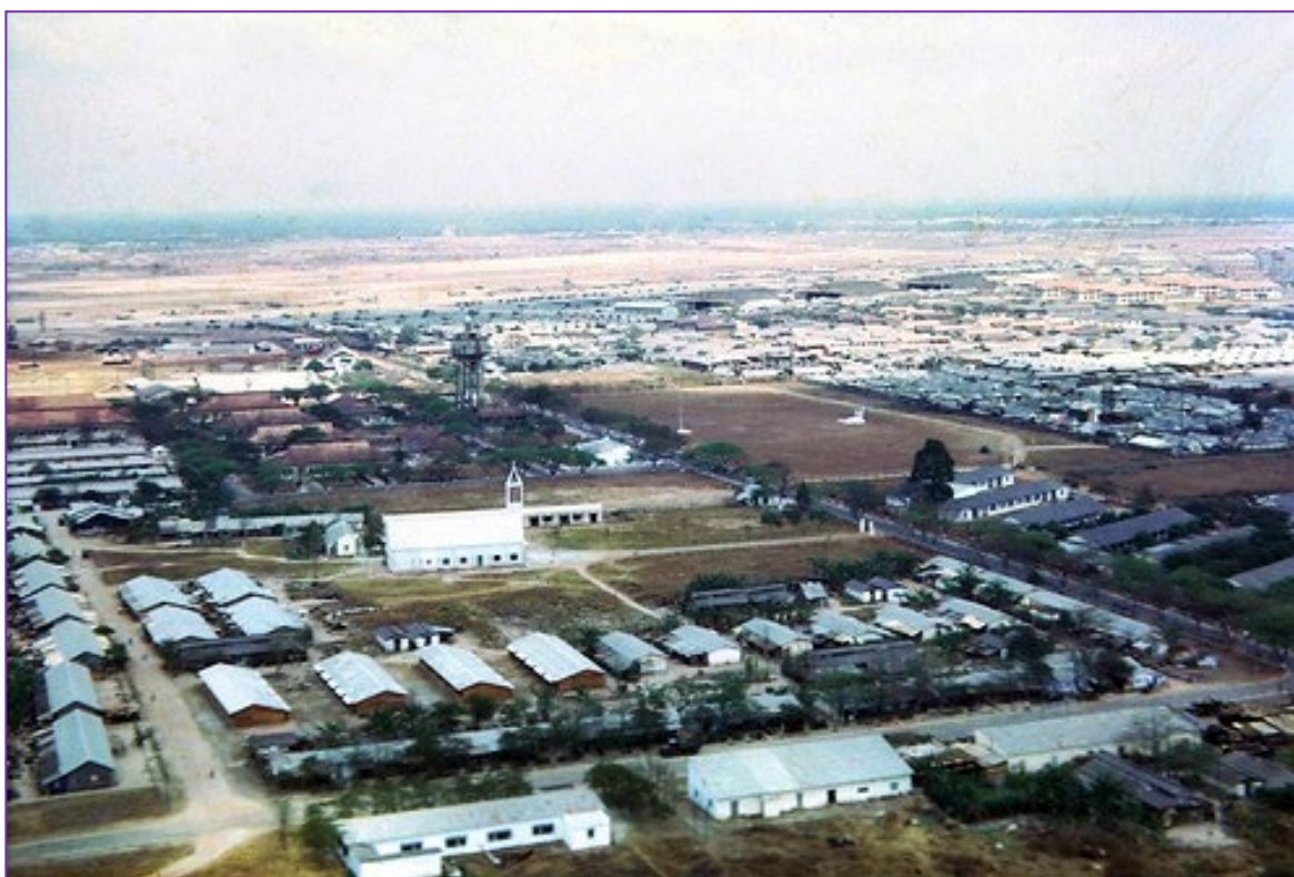
Trại Hoàng Hoa Thám – Bộ Tư Lệnh Sư Đoàn Nhảy Dù