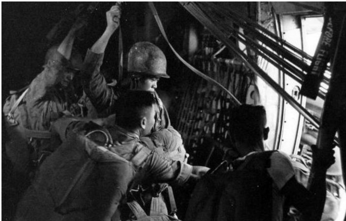
C123 gài thét phóng vọt lên – Qua khung cửa đèn Sài Gòn hoa lệ...