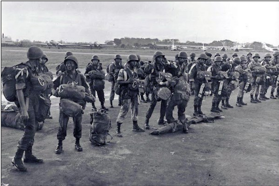
Khám dù chuẩn bị lên phi cơ