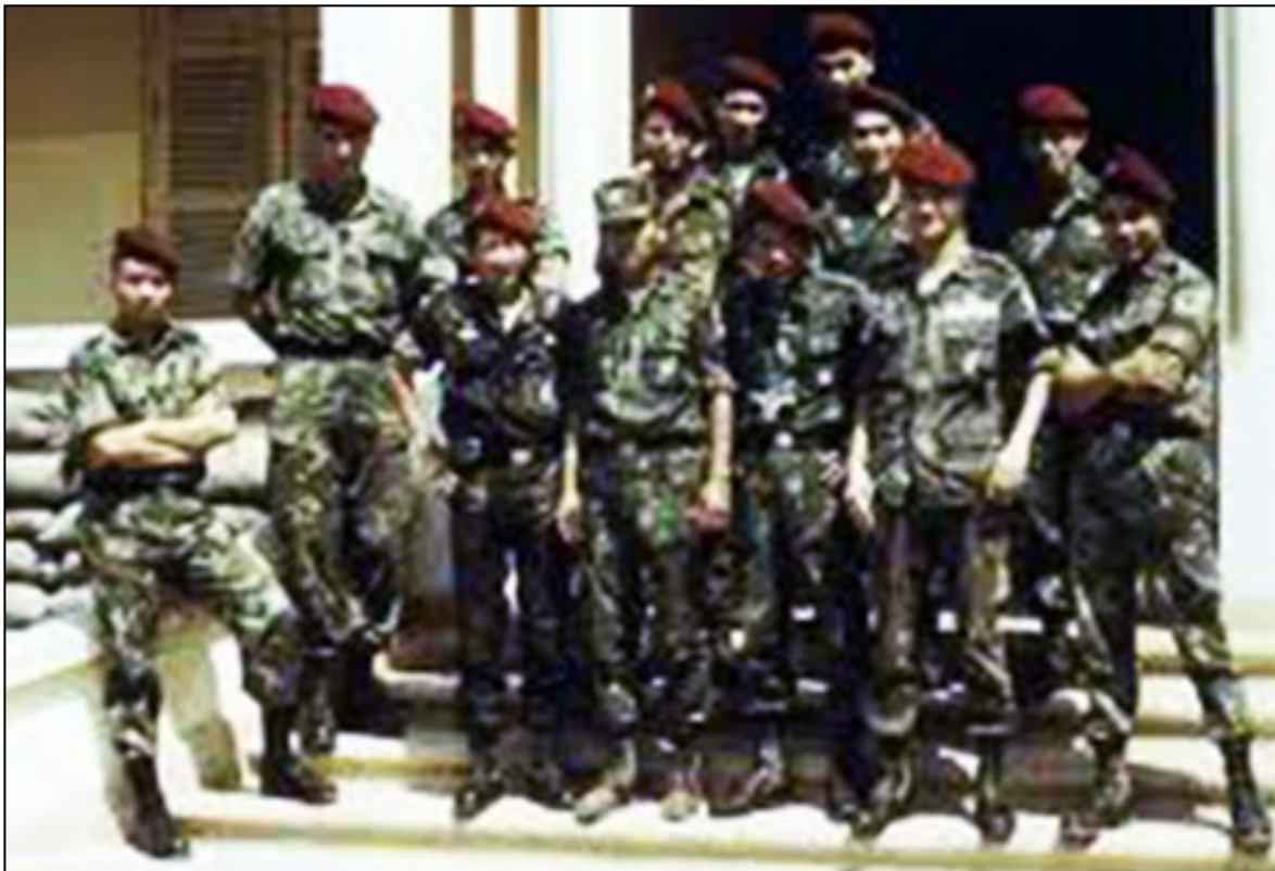
Tiểu Đoàn Yểm Trợ SĐND