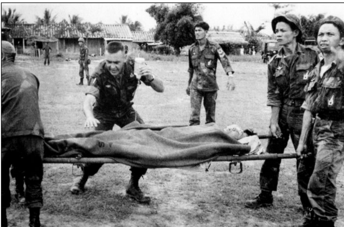
Tân thương nơi mặt trận của các Bác sĩ Thiên Thần