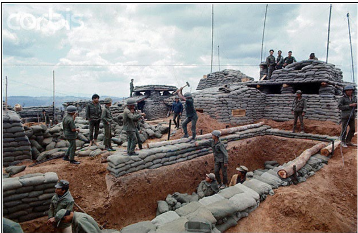
Lam Sơn 719 – Kiên cố và vững chắc