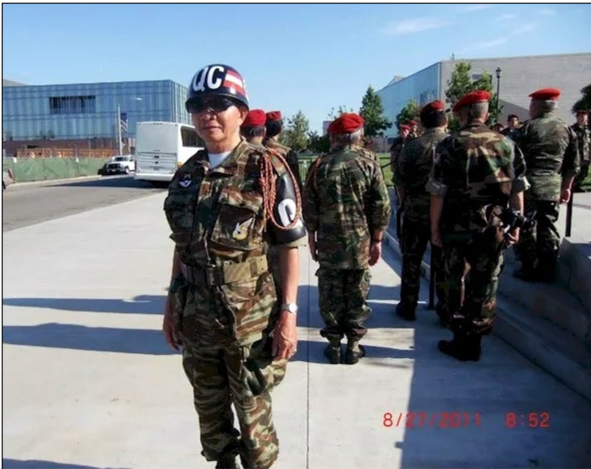
Chân Dung Quân Cảnh Nhảy Dù 204