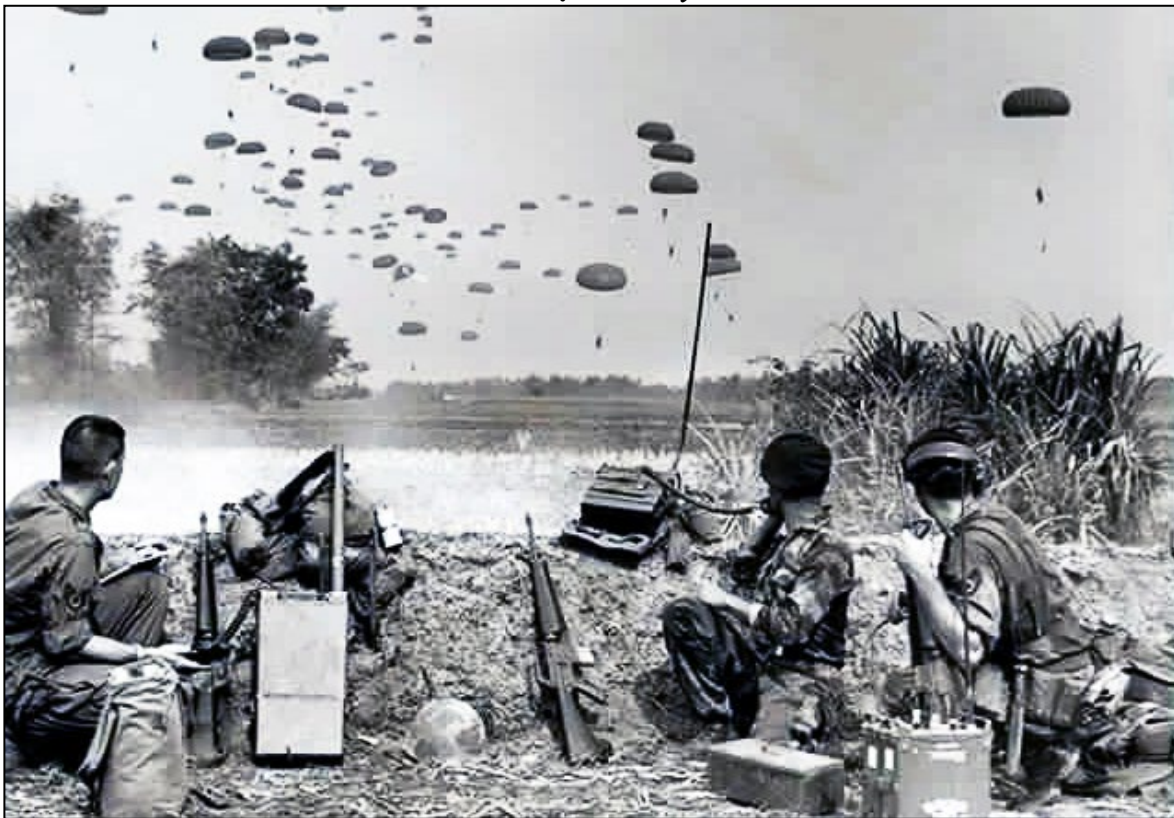
Hành quân Nhảy Dù – liên lạc chỉ huy