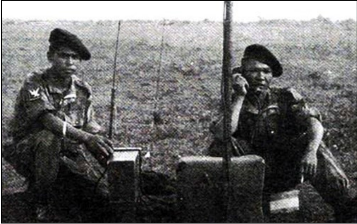
Liên Lạc Chỉ Huy