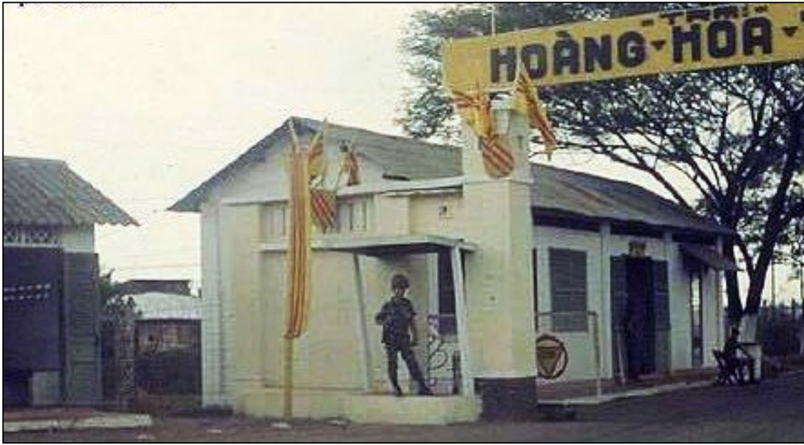
Đồn Quân Cảnh 204 tại Công Trại Hoàng Hoa Thám – BTL Sư Đoàn Nhảy Dù