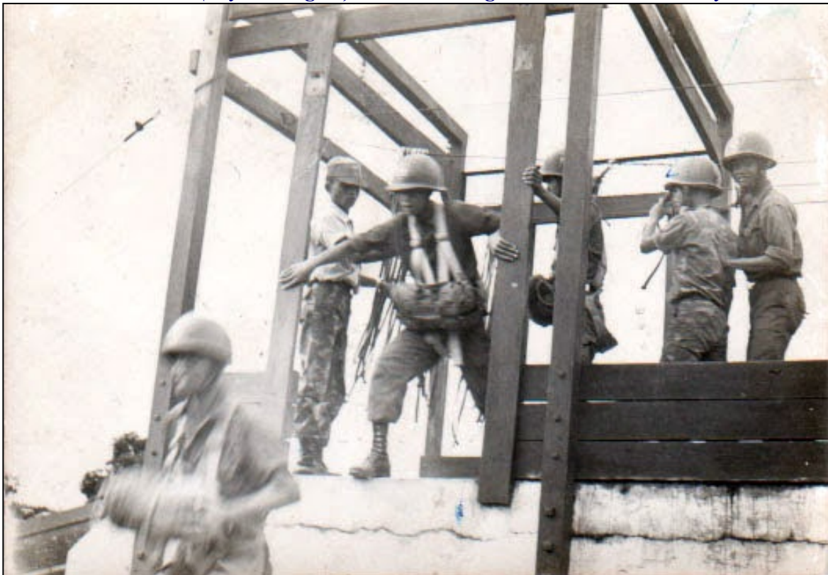
Máy bay giả ? Chuẩn bị trước khi tung mình ra khỏi “chim sắt”