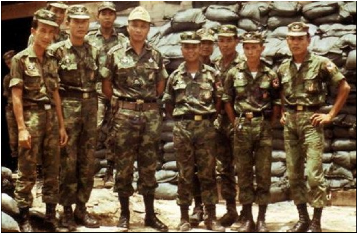
Y sĩ tiên tuyến Nhảy Dù