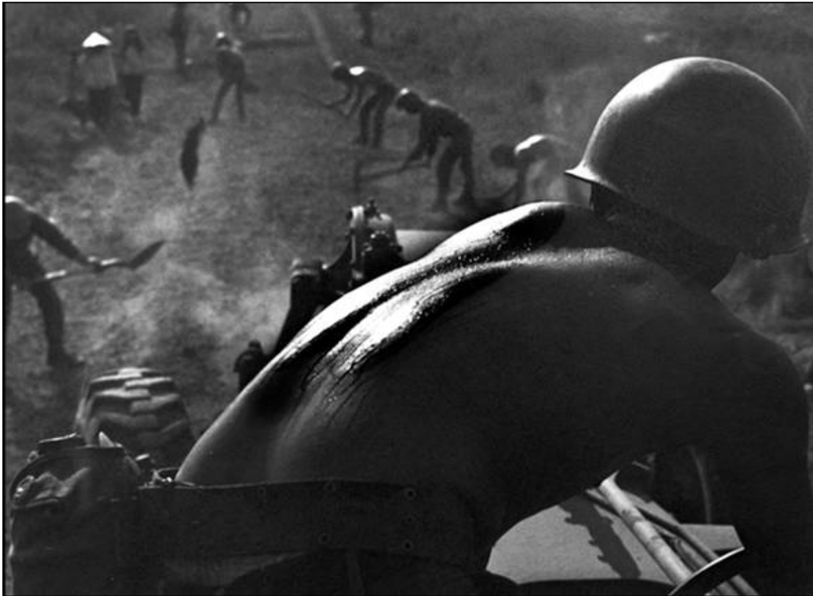
Làm đường – Ảnh của Nguyễn Ngọc Hạnh