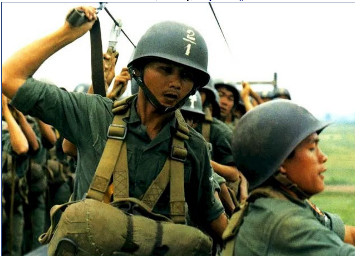
Các khoá sinh đang móc dù vào dây S.O.A (chuẩn bị GO...)

“Màn ké tiếp ba tuần liền dưới đất: Tập chuồng cu, kéo gió, chống dù lồi” Đài mười thước, rồi nhảy, nhảy chuồng cu!