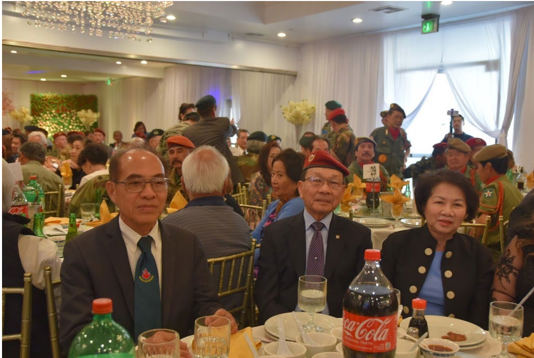
(Tác giả trong bàn Mũ Đỏ)

(Đính kèm: một số hình ảnh của tác giả và một số do anh Thiệu Võ chụp)