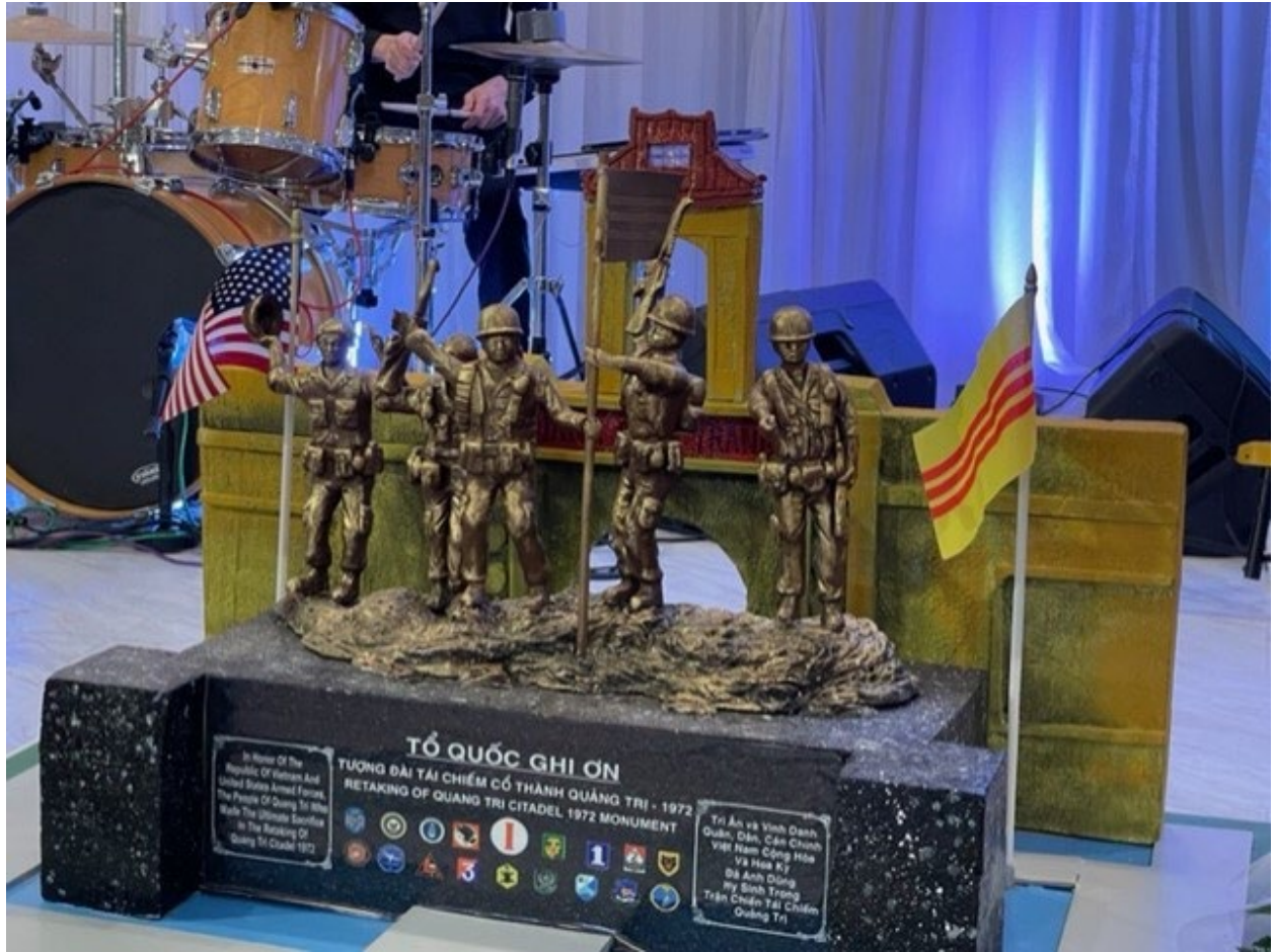
(Mô Hình Tượng Đài)