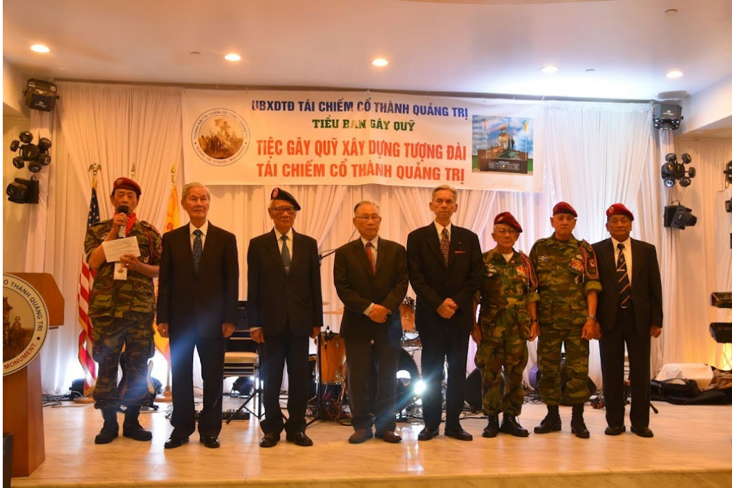
(Các cựu sĩ quan cao cấp)