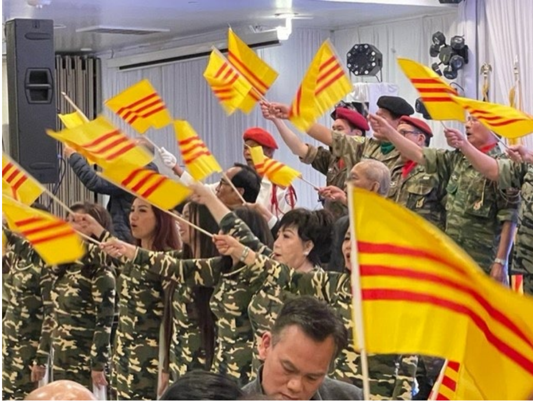
(Bài hát "Cờ Bay Trên Thành Phố Thân Yêu)