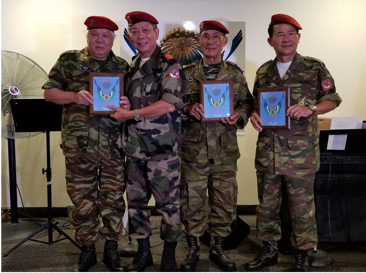
Tặng trophy lưu niệm cho các Chi hội