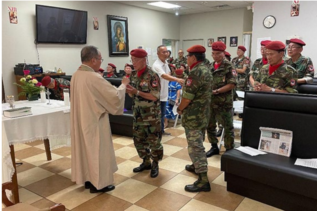
Cha Tuyên Ủy