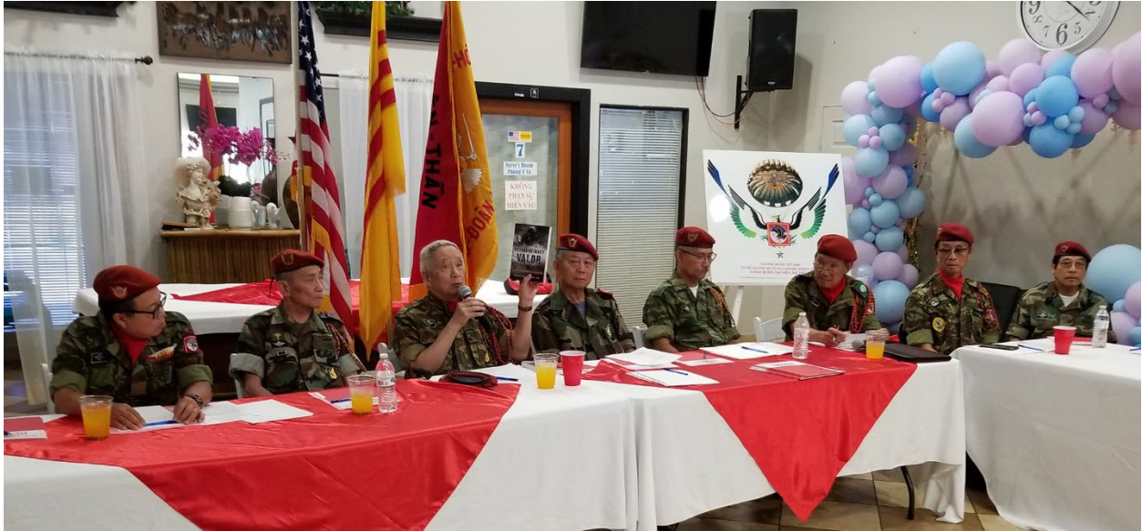
Ban chấp hành Gia Đình Mũ Đỏ Việt Nam và anh em Mũ Đỏ tham dự phiên họp