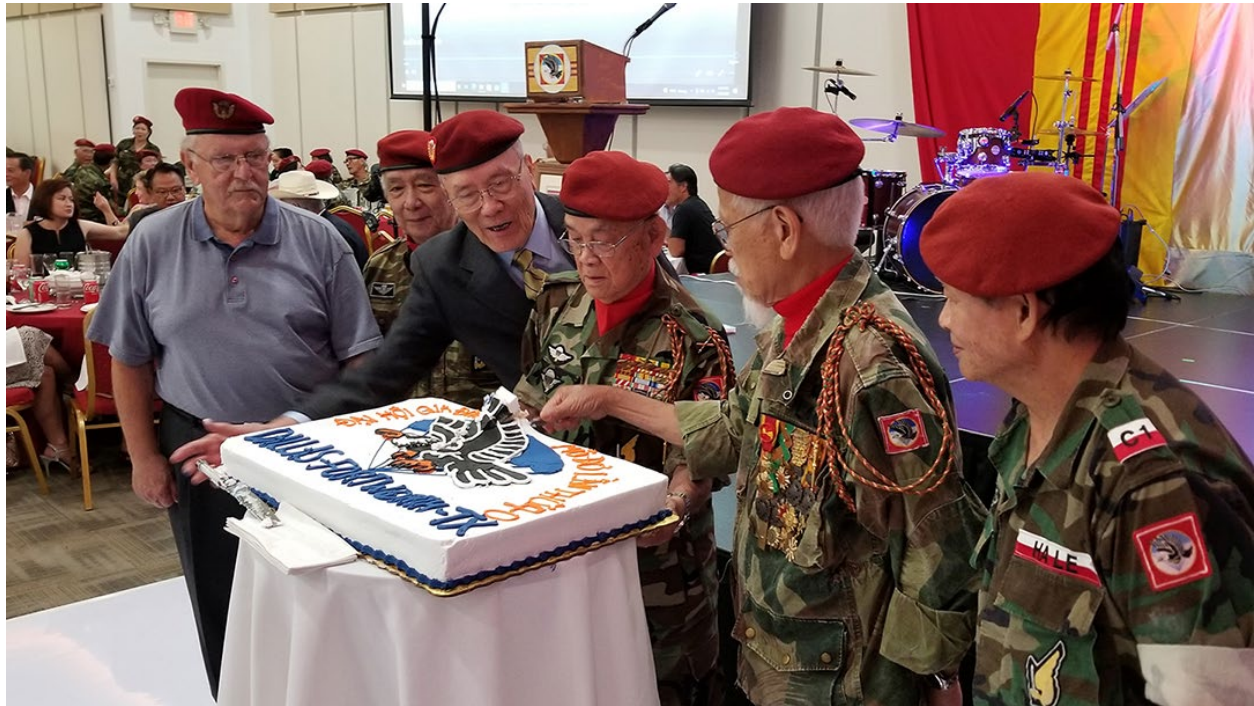
Quý niên trưởng và cố vấn Mỹ cắt bánh kỷ niệm Đại Hội Nhảy Dù Lần Thứ 40